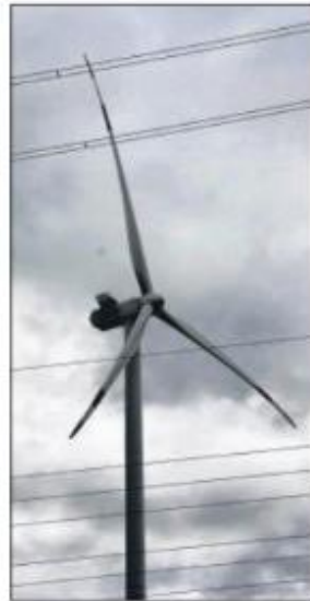
Aus Wind wird Strom: Die Windräder der Städtischen Werke brachten mehr Leistung als erwartet.

SÖHREWALD / NIESTETAL / KASSEL. Die sieben von den Städtischen Werken Kassel errichteten Windkraftanlagen in der Söhre und am Sandershäuser Berg bei Niestetal ha-